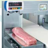
材料の重量測定完了後、肉送りベルトに載せ替えてスタートスイッチを押すだけ。

形状読みは変位センサにより非接触で行いますので衛生的で、商品を変形させることがありません。商品にストレスを与えないので商品価値が損なわれません。