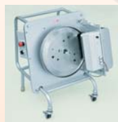
専用研磨装置で半自動研磨が可能