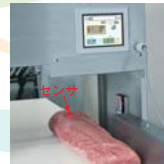
材料の形状を上下2個ずつの変位センサにより読み込み、自動でスライス開始。