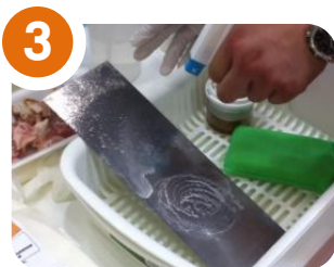
3 Kクリーンをスプレーすると油が溶けていきます