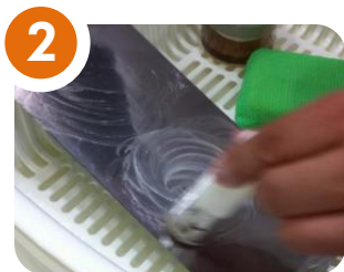
2 次にごま油をこすりつけます