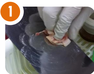
1 ステンレス板に豚脂をこすりつけます